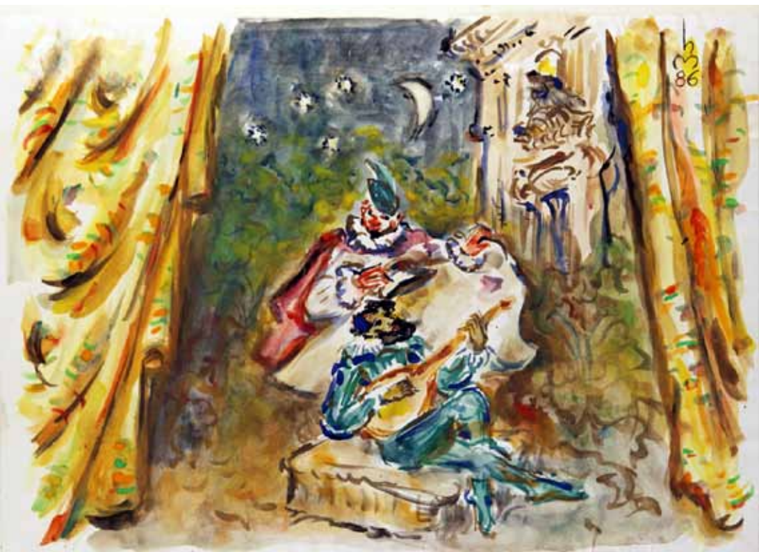
„3.) STÄNDCHEN“, 1986, „AQUARELL“, 30 x 42 cm