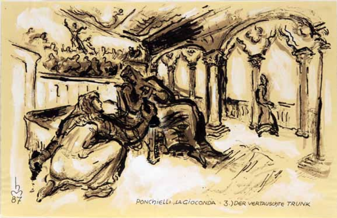
„PONCHIELLI, LA GIOCONDA 3.) DER VERTAUSCHTE TRUNK“, 1987, „TUSCHE“, 32 x 48 cm