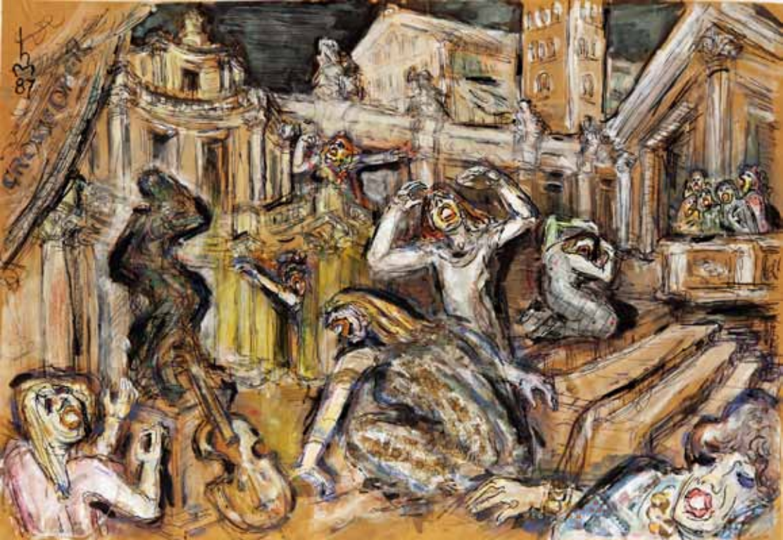
2.) „GROSSE OPER, OPERNSZENE“, (Auf dem Bühnenboden Aufschrift: GROSSE OPER“), 1987, „COLLAGE“, 34 x 43 cm