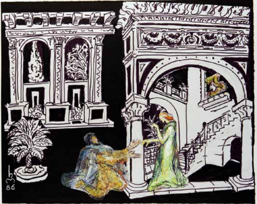
RIGOLETTO I. AKT: TREFFPUNKT HERZOG UND GILDA IN RIGOLETTO'S GÄRTCHEN. —