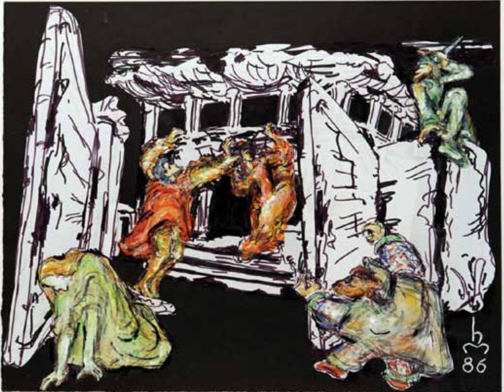
RIGOLETTO IV. AKT: SPELUNKE; HERZOG, MADDALENA, RIGOLETTO, GILDA, SPARAFUCILE