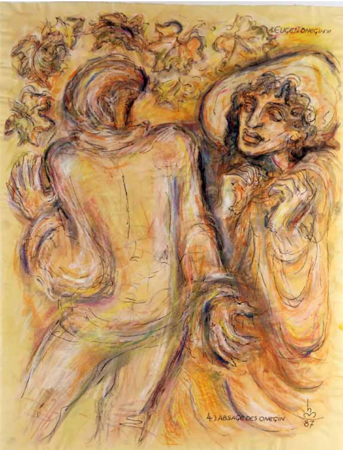
„4.) ABSAGE DES ONEGIN“, 1987, „FEDER, PASTELL ÜBER AQUARELL“, 63 x 49 cm