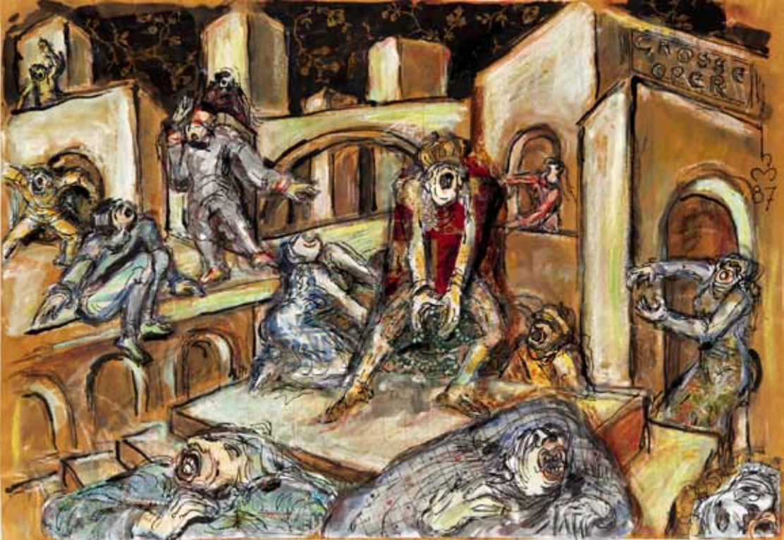
1.) „GROSSE OPER, OPERNSZENE“, (Auf einem Portal rechts im Bild Aufschrift: GROSSE OPER“), 1987, „COLLAGE“, 34 x 43 cm