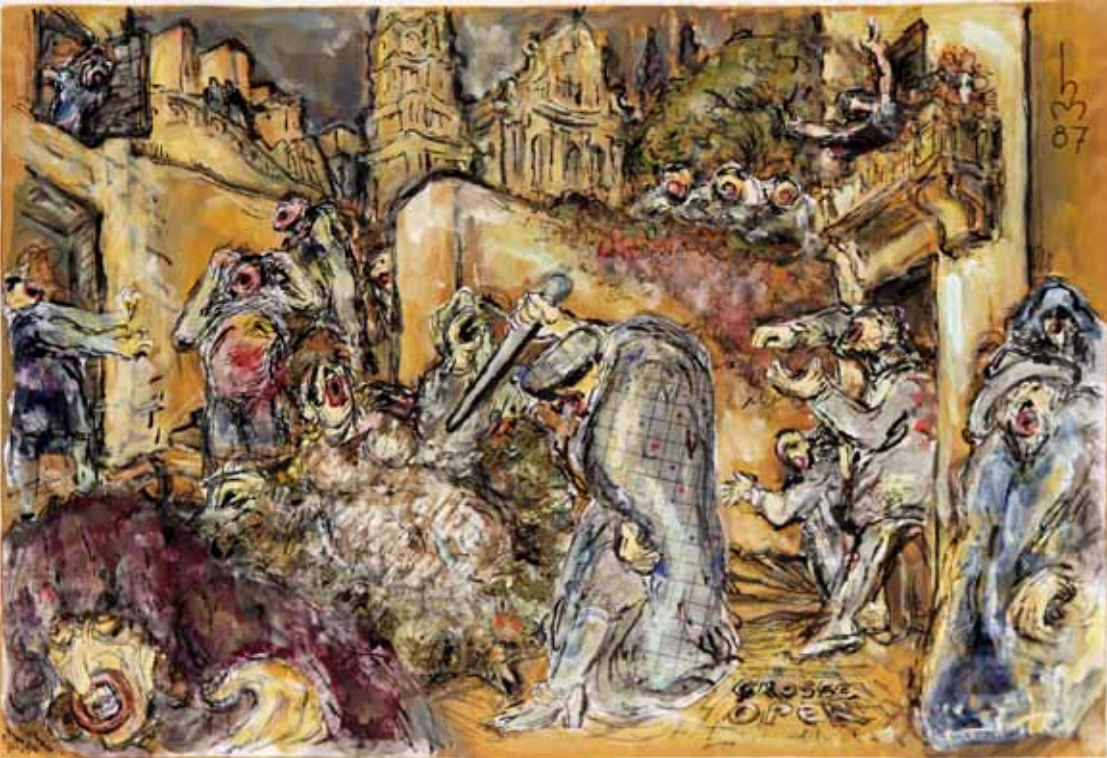
3.) „GROSSE OPER, OPERNSZENE“, (Links oben unter der Signatur Aufschrift: GROSSE OPER“), 1987, „COLLAGE“, 34 x 43 cm