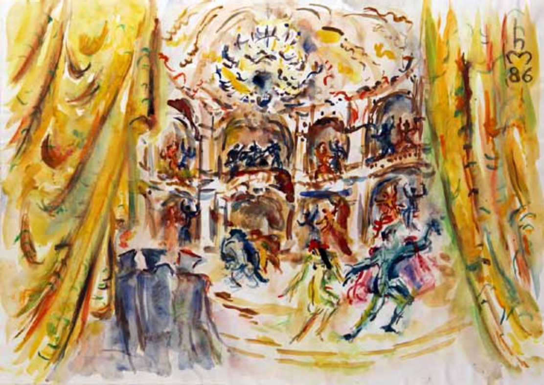
„5.) FESTSAAL“, 1986, „AQUARELL“, 30 x 42 cm