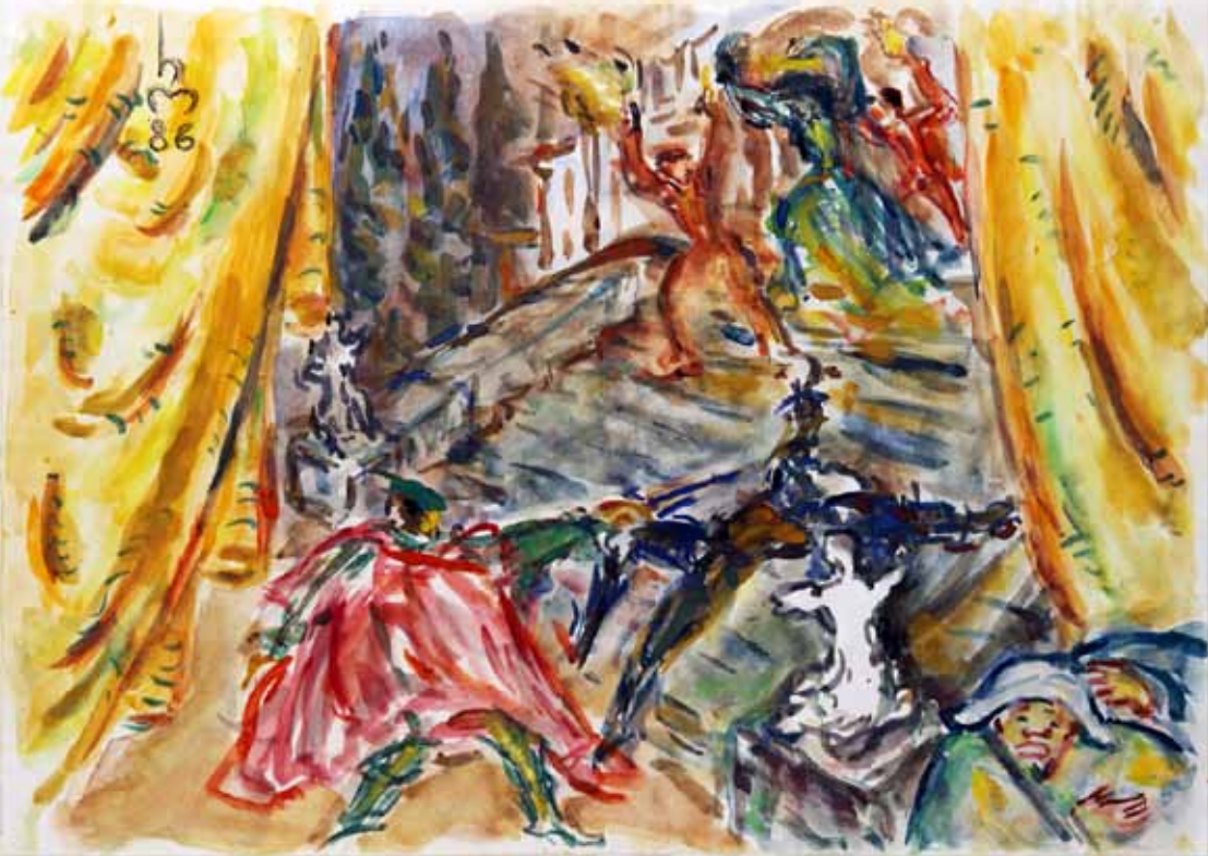
„1.) DUELL“, 1986, „AQUARELL“, 30 x 42 cm