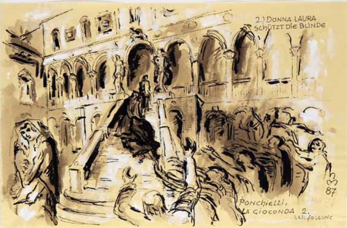
„PONCHIELLI, LA GIOCONDA 2. VERFOLGUNG 2.) DONNA LAURA SCHÜTZT DIE BLINDE“, 1987, „TUSCHE“, 32 x 48 cm