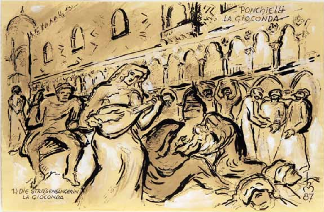
„PONCHIELLI, LA GIOCONDA 1.) DIE STRASSENSÄNGERIN LA GIOCONDA“, 1987, „TUSCHE“, 32 x 48 cm