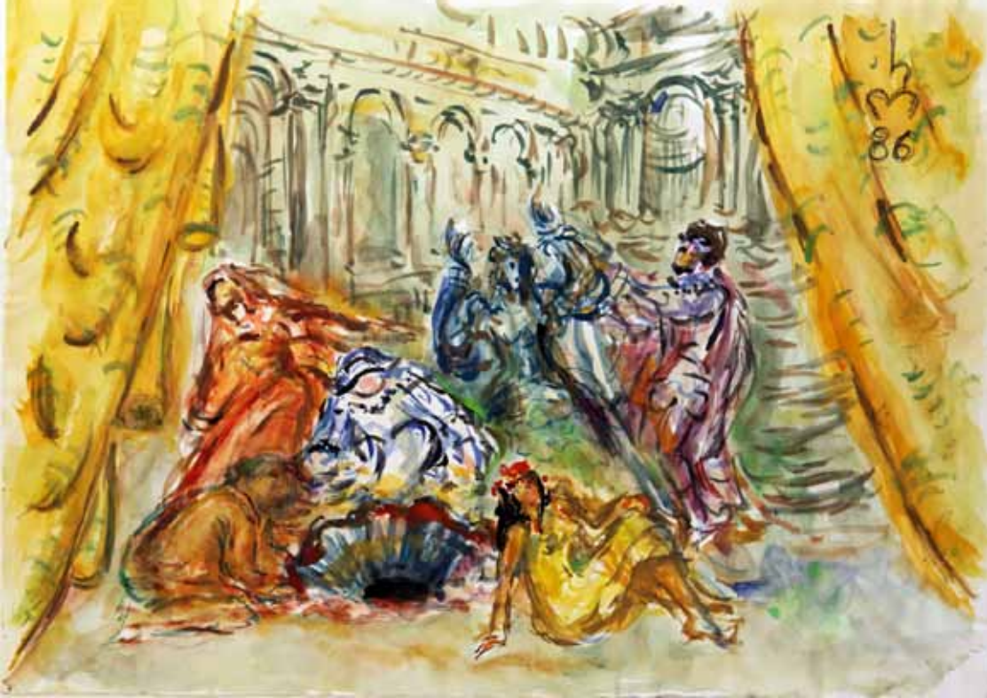
„9.) FINALE“, 1986, „AQUARELL“, 30 x 42 cm