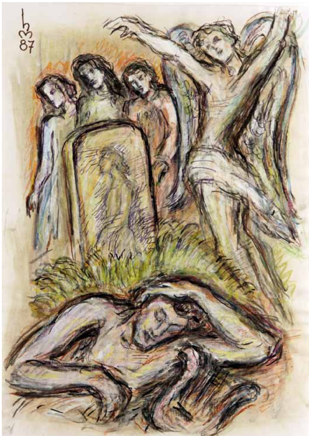
„4.) GLÜCKLICHES ENDE“, 1987, „MISCHTECHNIK“, 42 x 30 cm