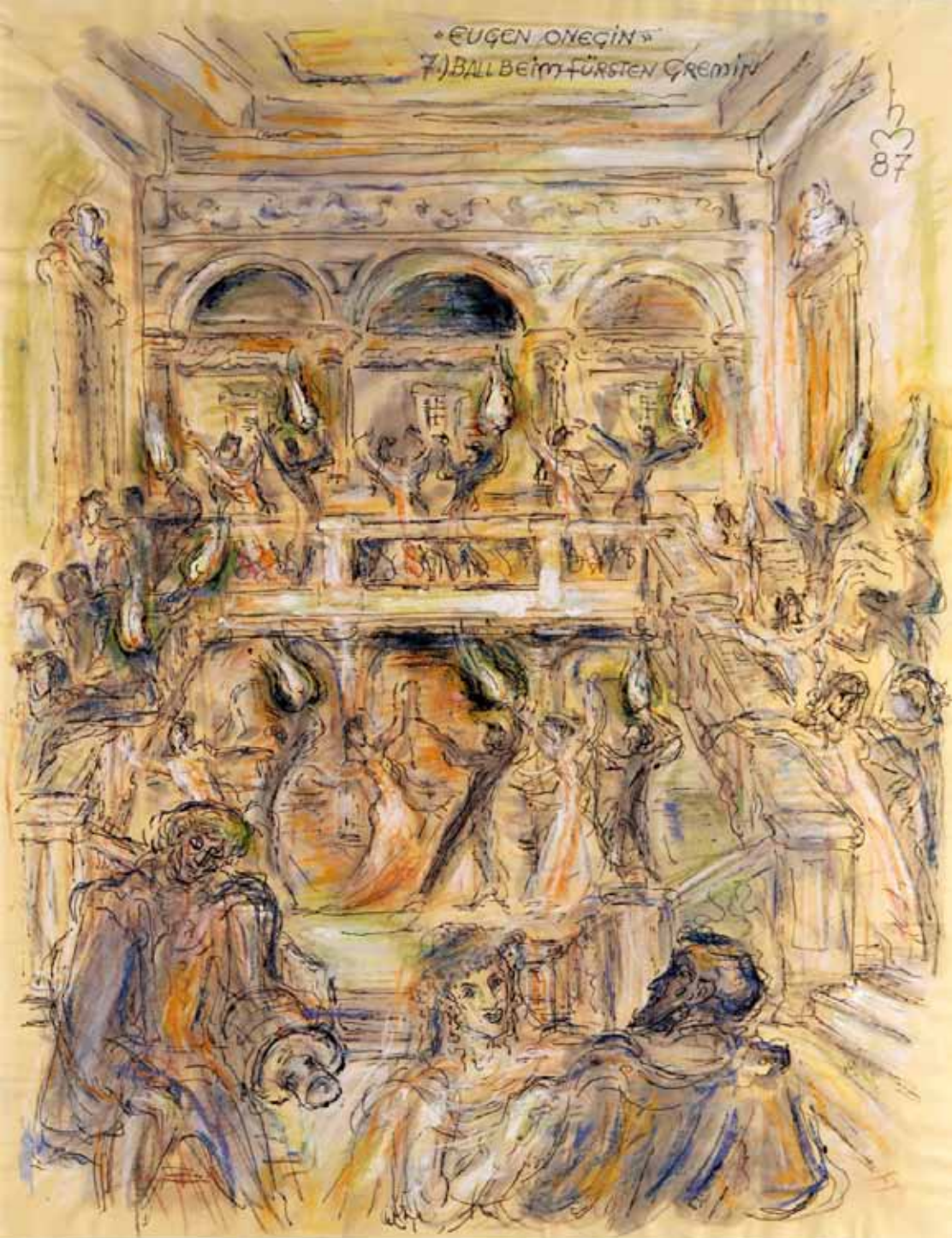
„7.) BALL BEIM FÜRSTEN GREMIN“, 1987, „FEDER, PASTELL ÜBER AQUARELL“, 63 x 49 cm