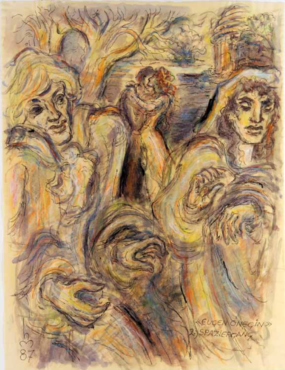
„2.) SPAZIERGANG“, 1987, „FEDER, PASTELL ÜBER AQUARELL“, 63 x 49 cm