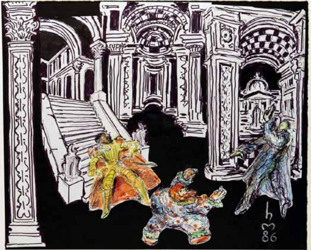
RIGOLETTO I. AKT : HERZOG, RIGOLETTO, GRAF MONTERONE

1.) "RIGOLETTO I. AKT: HERZOG, RIGOLETTO, GRAF MONTERONE", 1986, „KLEBEARBEIT MIT ZEICHNUNG SCHWARZWEISS, FIGURINEN FARBIG“, 30 x 36 cm