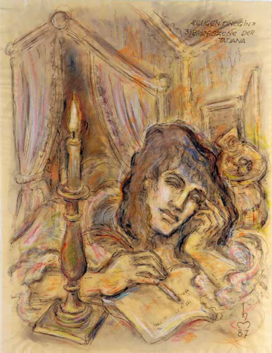
„3.) BRIEF DER TATJANA“, 1987, „FEDER, PASTELL ÜBER AQUARELL“, 63 x 49 cm

«EUGEN ONEGIN» 3.) BRIEF SZENE DER TATJANA