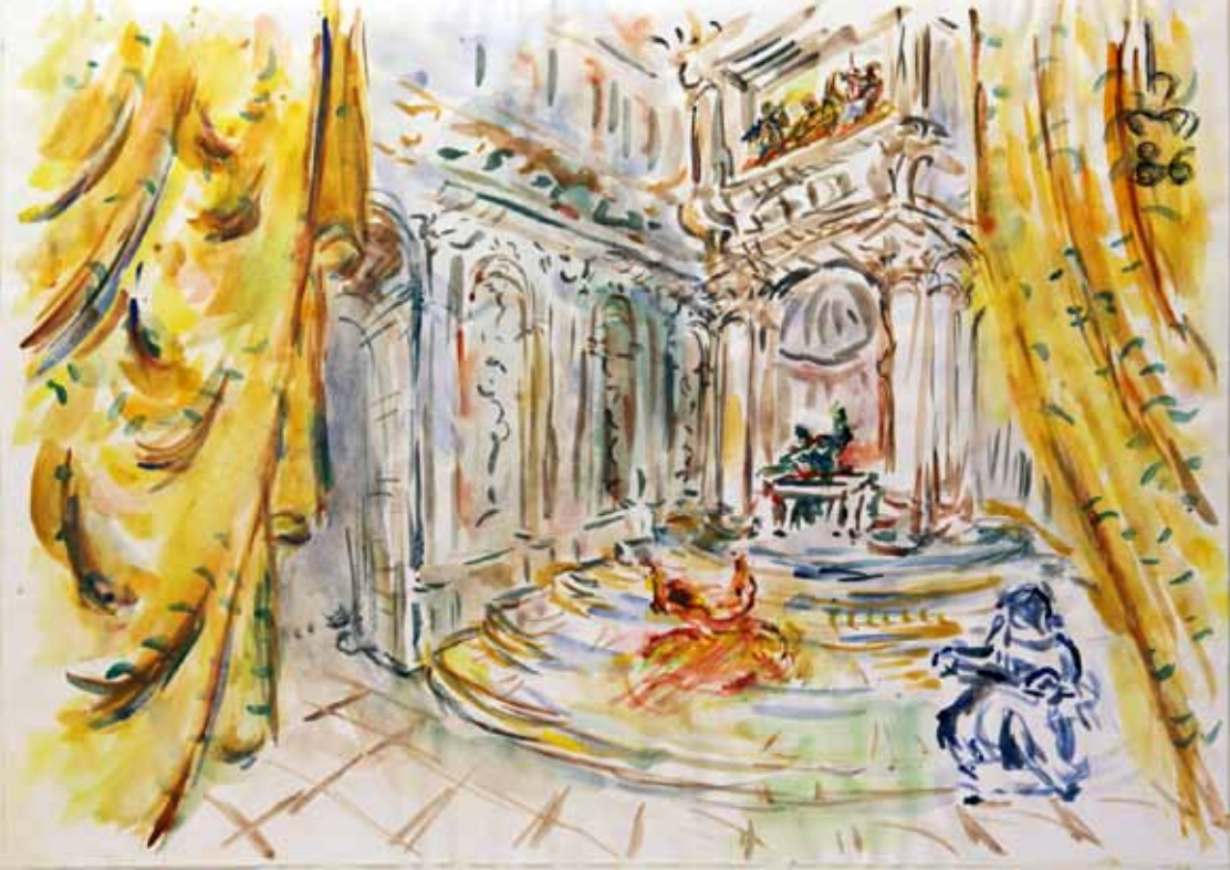
„7.) DAS ABENDESSEN“, 1986, „AQUARELL“, 30 x 42 cm