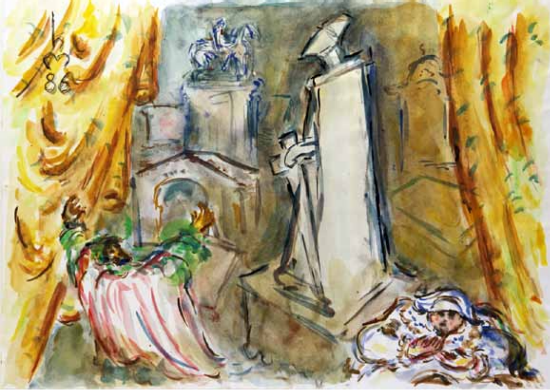
„6.) AUF DEM FRIEDHOF“, 1986, „AQUARELL“, 30 x 42 cm