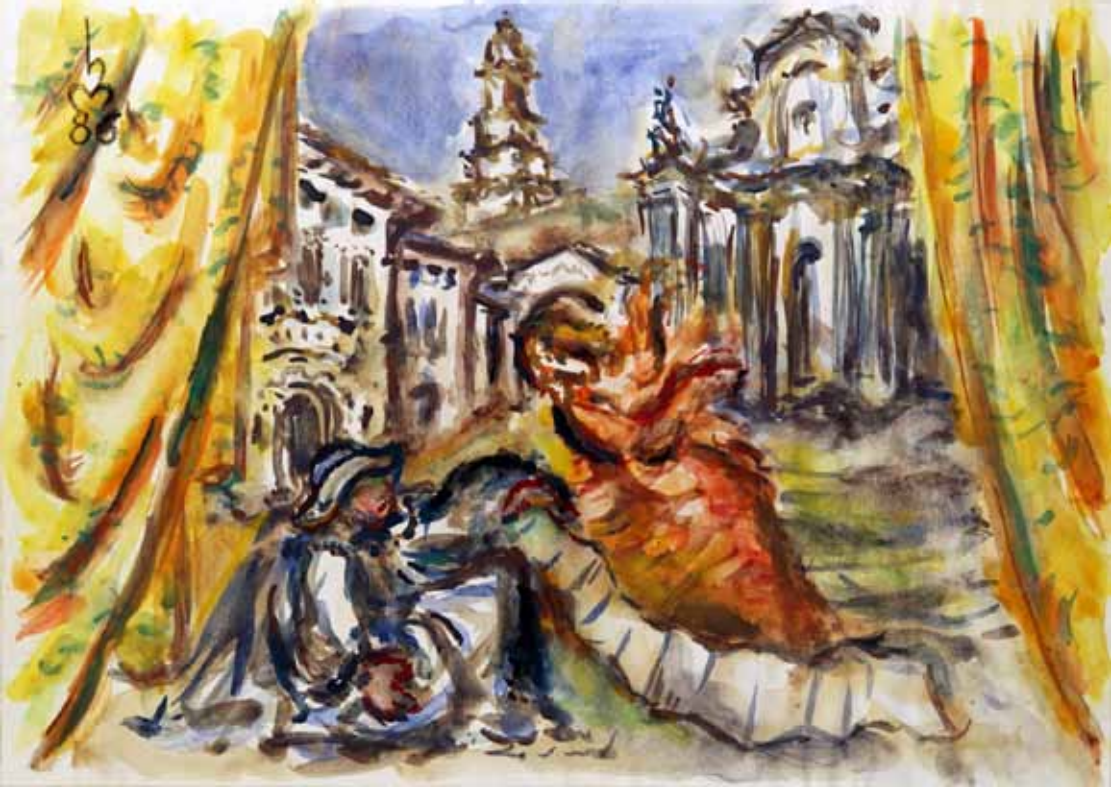
„2.) DAS WEIBER-REGISTER“, 1986, „AQUARELL“, 30 x 42 cm