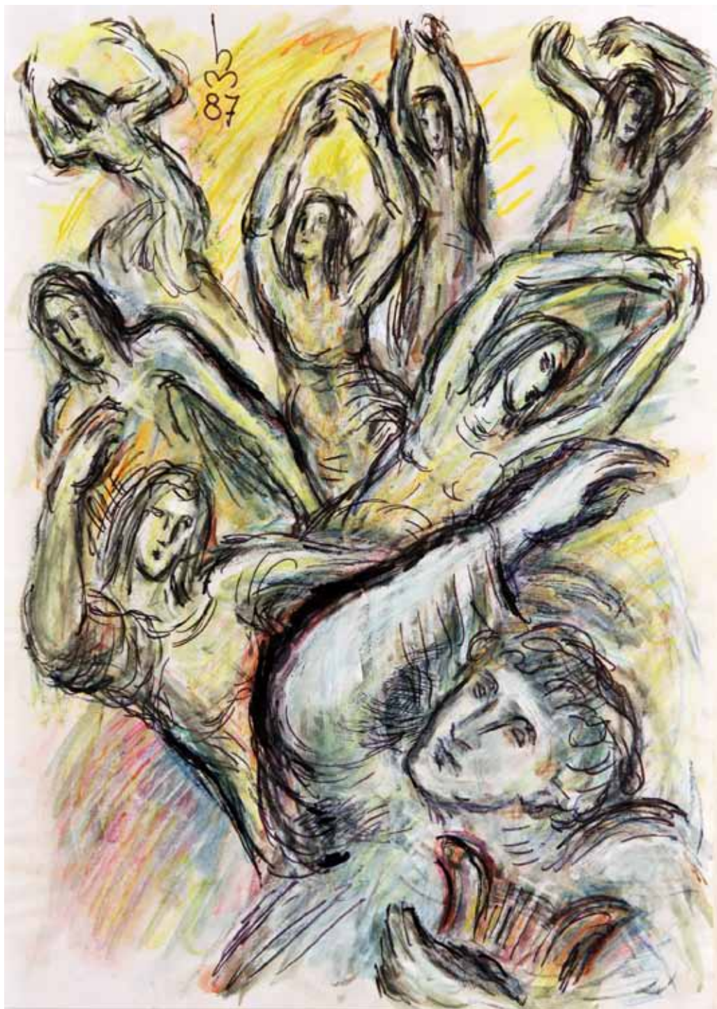
„1.) TOTENKLAGE“, 1987, „MISCHTECHNIK“, 42 x 30 cm