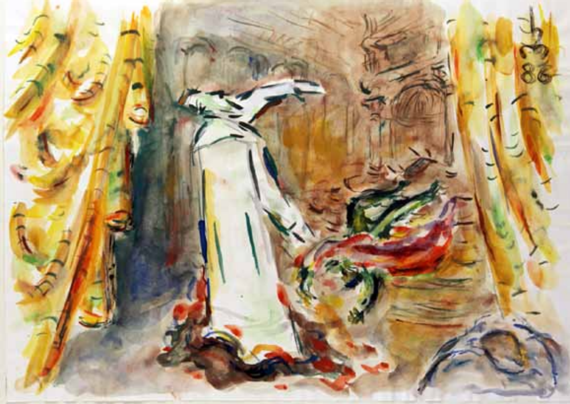
„8.) DER GEIST“, 1986, „AQUARELL“, 30 x 42 cm