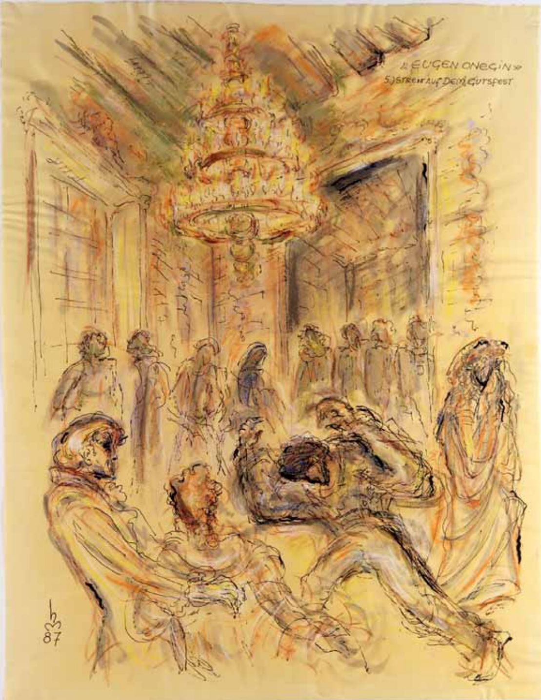
„5.) STREIT AUF DEM GUTSFEST“, 1987, „FEDER, PASTELL ÜBER AQUARELL“, 63 x 49 cm