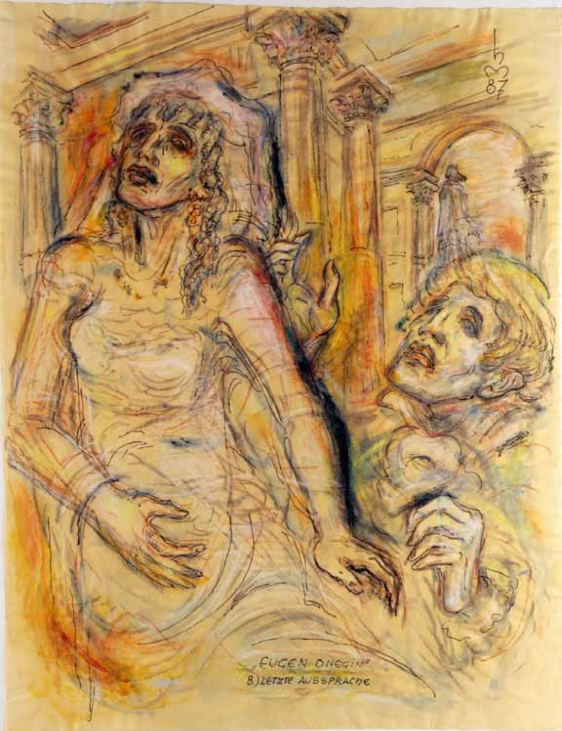
„8.) LETZTE AUSSPRACHE“, 1987, „FEDER, PASTELL ÜBER AQUARELL“, 63 x 49 cm