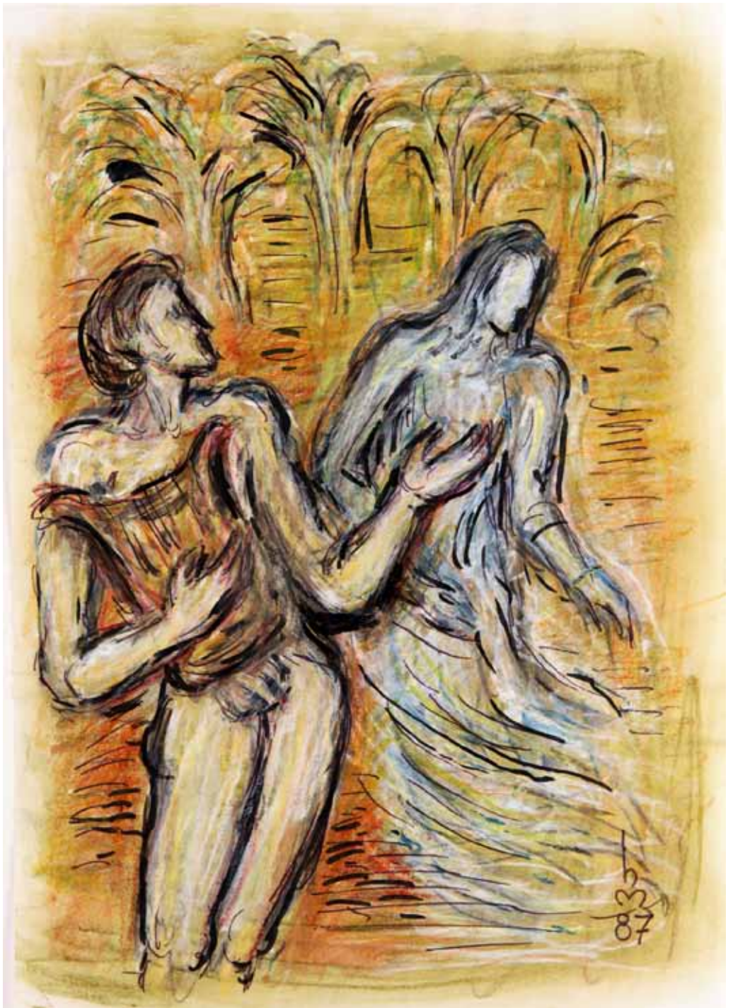
„2.) DIE FURIEN“, 1987, „MISCHTECHNIK“, 42 x 30 cm