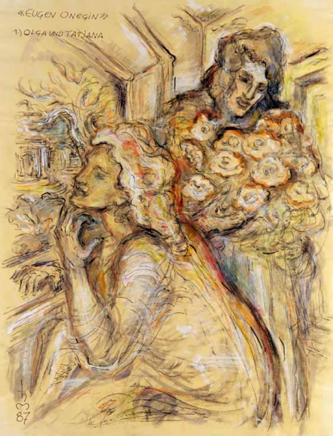
„1.) OLGA UND TATJANA“, 1987, „FEDER, PASTELL ÜBER AQUARELL“, 63 x 49 cm