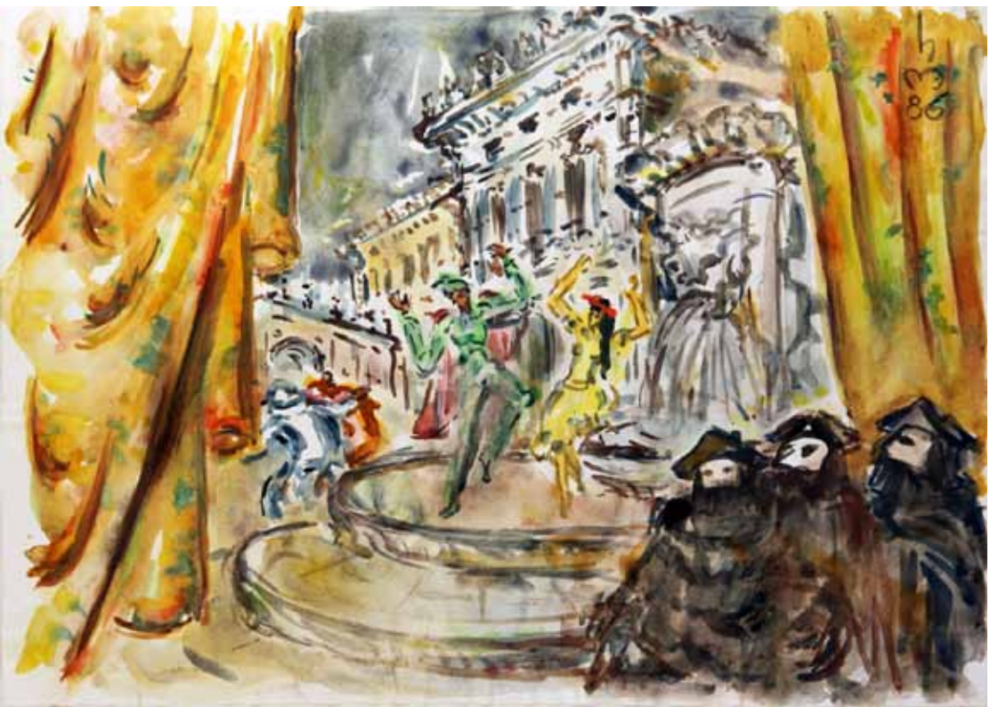
„4.) VERFÜHRUNG (ZERLINE)“, 1986, „AQUARELL“, 30 x 42 cm