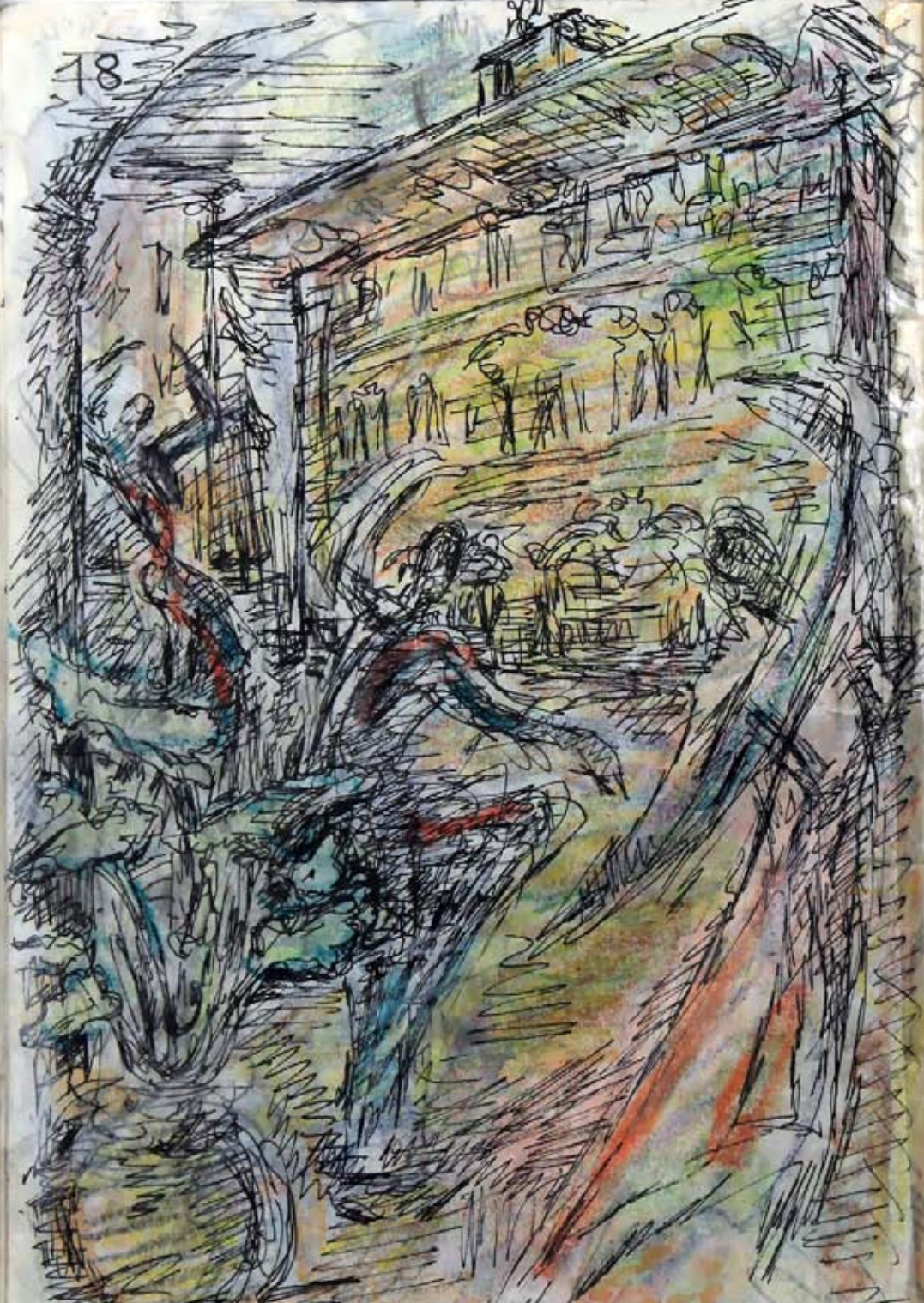
Platz vor dem Ratspalast