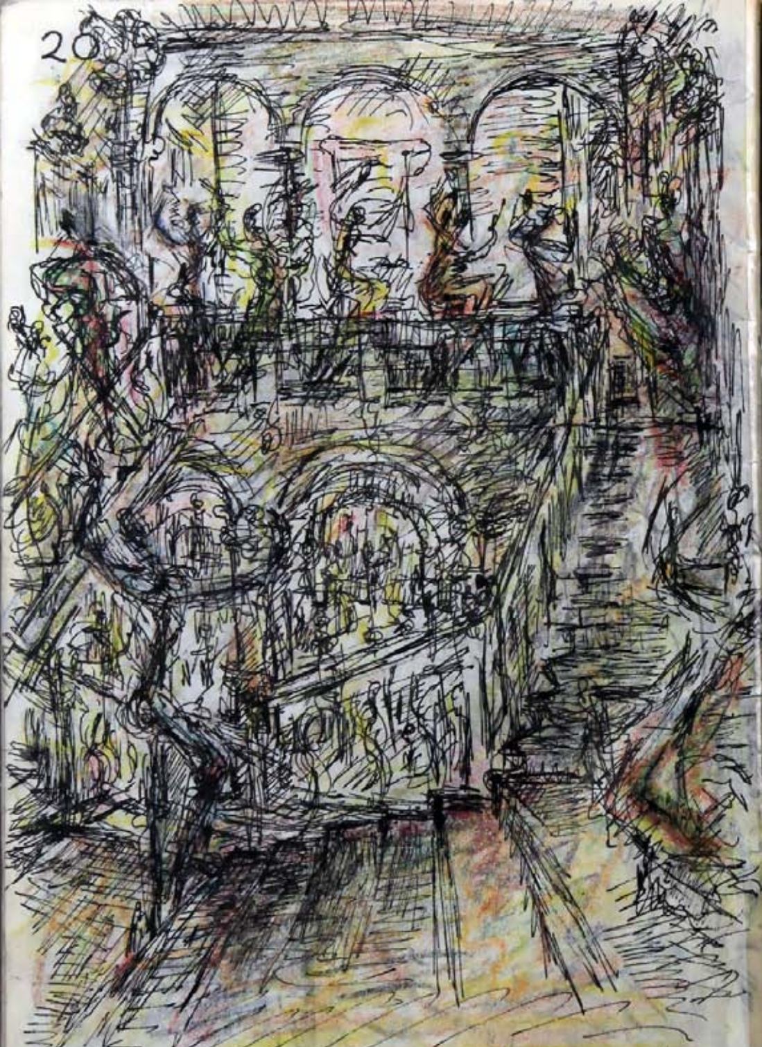
REIHE NZUG DURCHS TREPPENHAUS